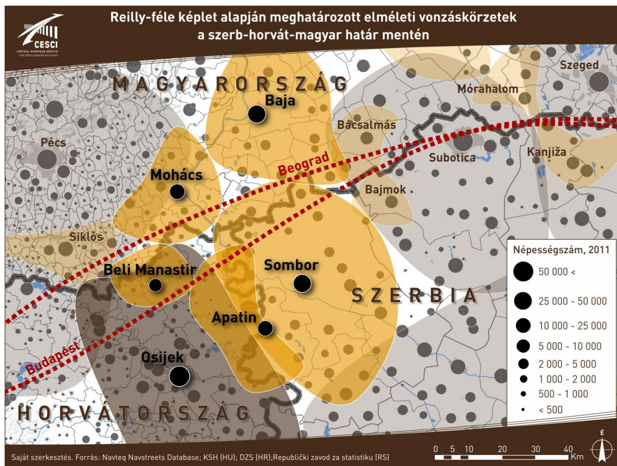
2. ábra: Vonasközpontok és azok elméleti gravitációs vonzaskörzetei a szerb-horvát-magyar határtér-ségében

egy nyugati (Pécs, Eszék, kisebb részt Pélmonostor, Mohács) és egy keleti (elsősorban Baja, Zombor, Apatin, a tágabb régióban pedig Szabadka, Szeged) együttműködési térséget.