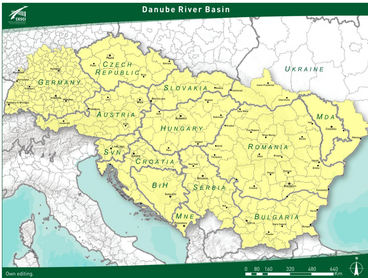
1. ábra: Az Európai Unió Duna Régió Stratégiájának célterülete

Ahogy a későbbiekben látni fogjuk, a partnerek elképzeléseinek túlnyomó része valamilyen formában megtalálható az EU Duna Régió Stratégiájának tartalmi keretei között. Éppen ezért jelen együttműködésnek fontos szerepe lehet az általa lefedett speciális hármashatár-helyzetű térségen belül az EUSDR célkitűzéseinek megvalósításában. Ehhez hatékony érdek-képviselőre, a Duna-medence fejlesztéspolitikai célkitűzéseivel tisztában levő intézmény- és projektfejlesztési tevékenységekre, a térség, mint önálló szerveződés nemzetközi szinten való megjelenítésére van szükség. A térségi elképzelések megvalósításának tekintetében fontos körülmény, hogy a Stratégia magyar nemzeti koordinációja szerepet vállal a mikrotérségi együttműködés támogatásában. Ráadásul a prioritási területeinek irányításában is hangsúlyos szerepet játszanak a magyar koordinátorok. Kiemelten igaz ez a vízügy és energetika terén, mely jó háttérrel adhat a kapcsolódó Duna Régiós szintű projektek sikeres finanszírozásához.