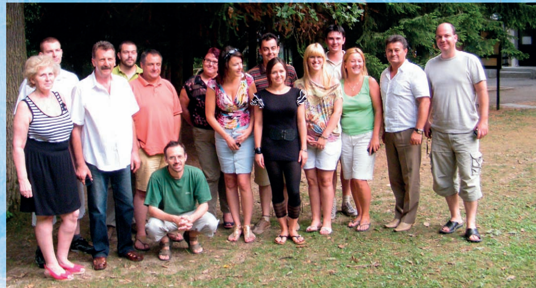
Az ETT-k a salgóbányai műhelyen

Az egyesület 2012. évi tevékenységéről az alábbi tájékoztató nyújt bővebb információt.