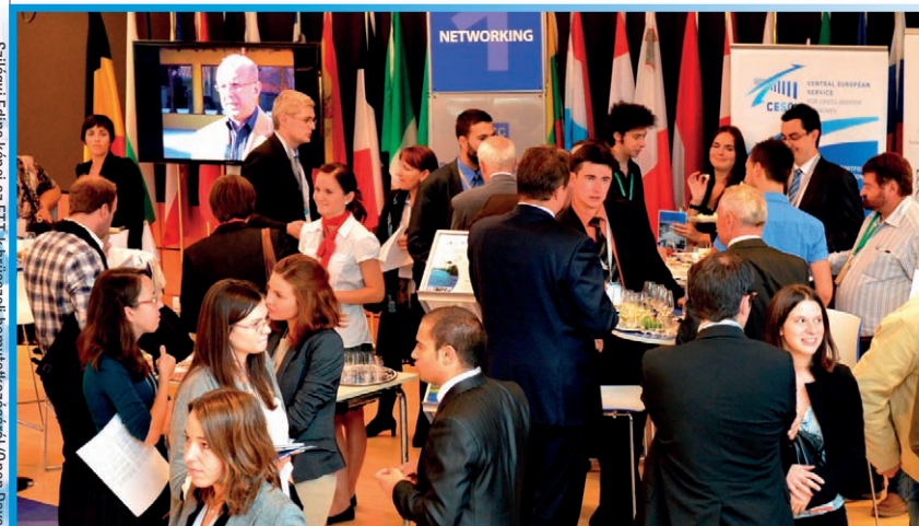
Nagy a forgalom a magyar standnál