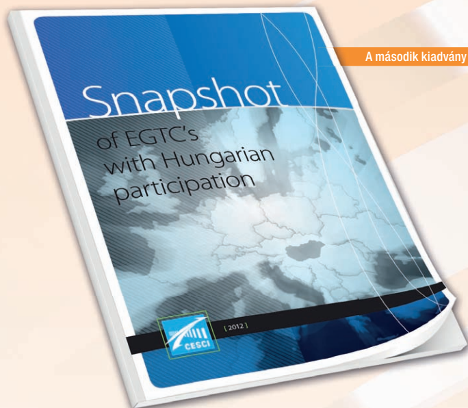
A második kiadvány