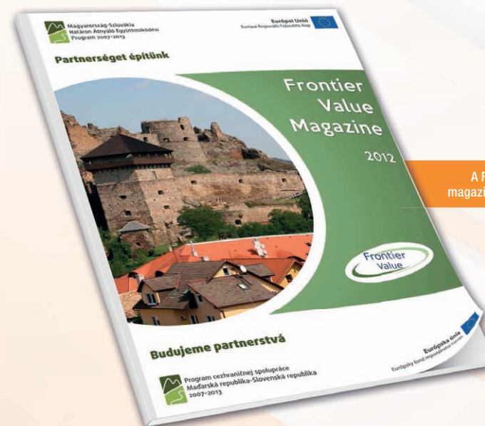
A Frontier Value magazin első száma

Októbertől kezdve indítottuk el újra kétnyelvű (magyar, angol) elektronikus hírlevélünket. A hírlevél kéthavonta jelenik meg, a regisztrált megrendelők automatikusan kapják. Állandó rovatai: belső hírek (a CESCI életéből), ETT (az ETT-kkel kapcsolatos uniós és magyarországi hírek), EU-s hírek, Bibliográfia (a határ menti kérdésekkel kapcsolatos szakirodalom bemutatása).