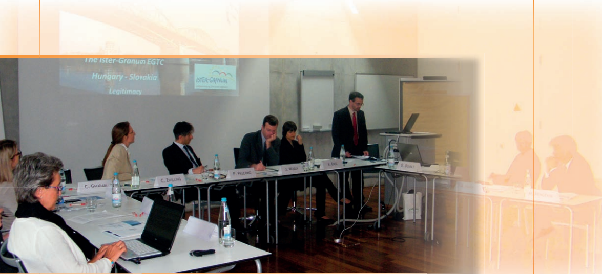
Előadás a bolzanói szemináriumon