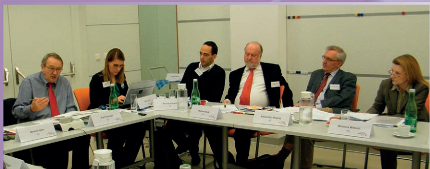
Duna Stratégia 10-es prioritási terület 3-as munkacsoport ülése Bécsben