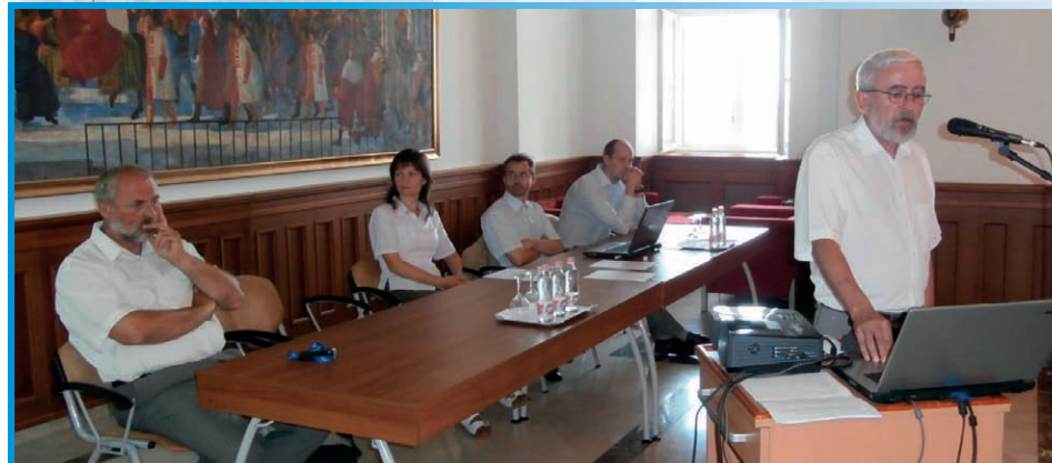
A Frontier value projekt nyitó konferenciája

A CESCI – legtöbbször alvállalkozóként – határ menti stratégiai tervezési munkákban is részt vesz, ahol minden esetben igyekszünk érvényre juttatni a 2012-ben kidolgozott, kohézió alapú tervezési módszertanunk alapelveit.