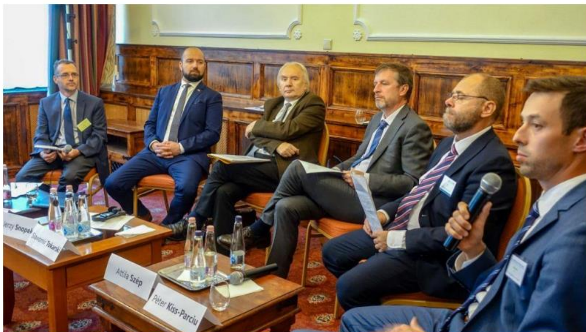
2. Ábra: A Fórum résztvevői

Koktél és fogadás a szálloda teraszán (17.30-tól)