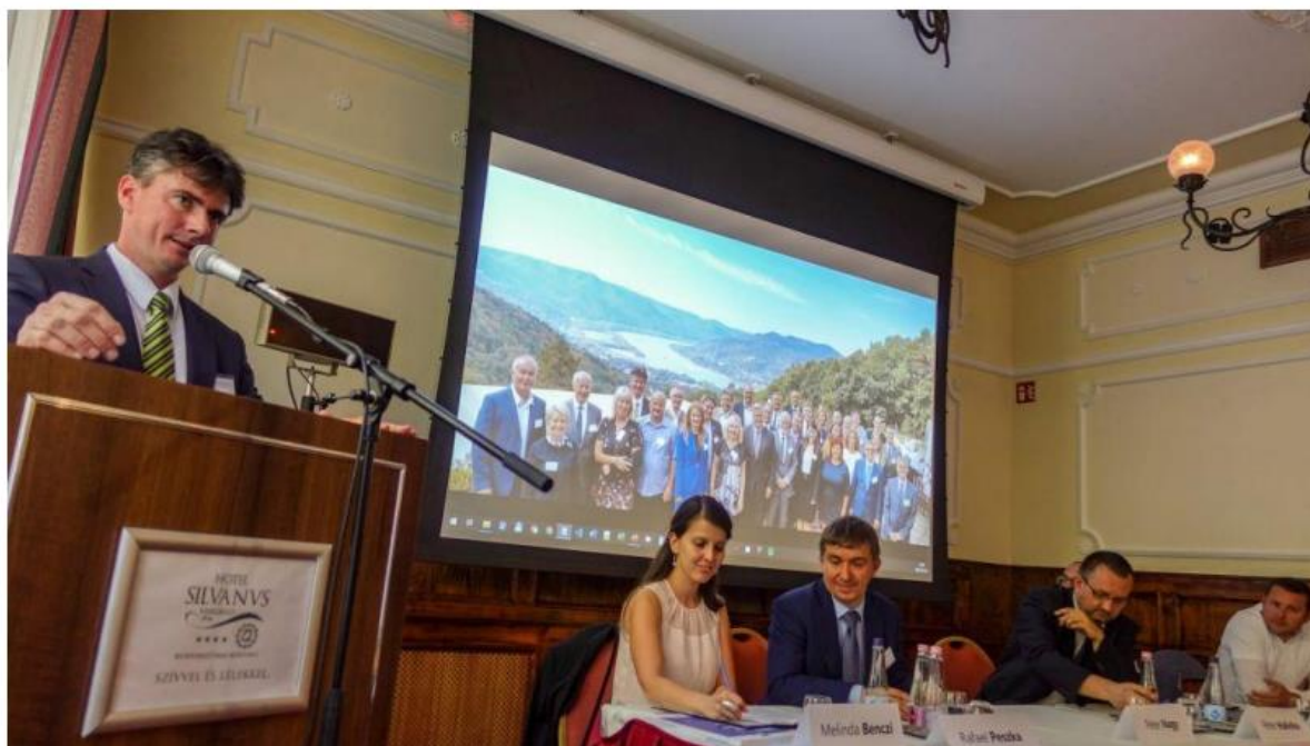
3. Ábra: A Konferencia résztvevői

A fórum és a konferencia után két különböző beszámoló készült. Az egyik a nagyközönség számára, amely részletesen beszámol az eseményről 13 . A másikat az Európai Bizottságnak szántuk, amely átfogó képet nyújt az egész témáról 14 . Mindkettő olvasható a projekt honlapján angol és magyar nyelven.